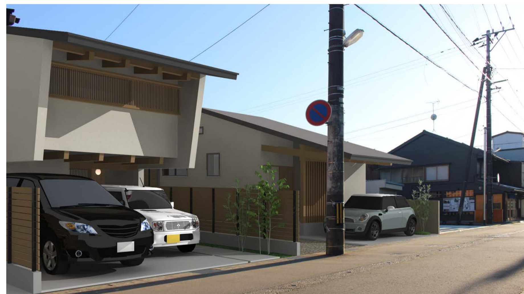
通りからのイメージ