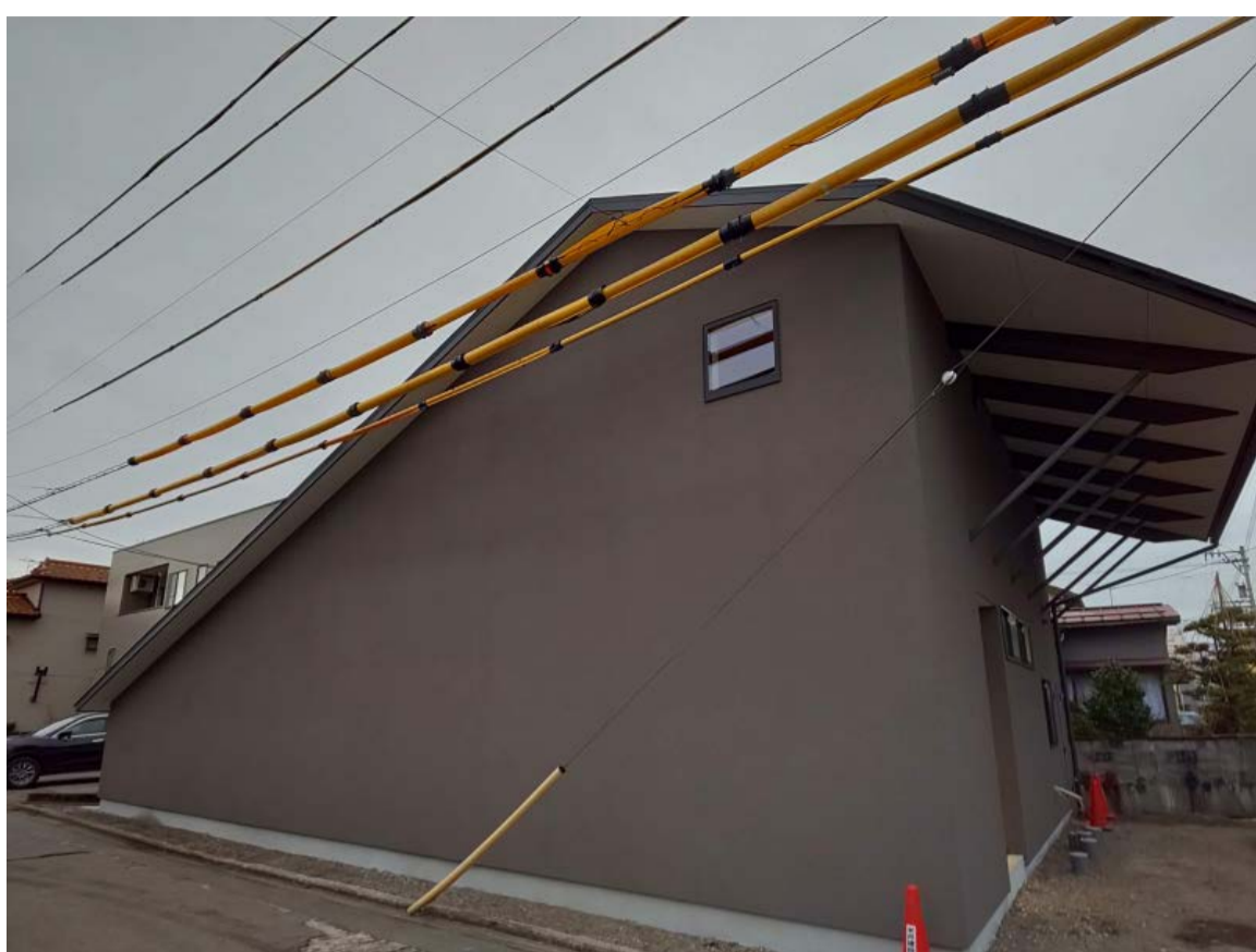
カーポート替わりになる深い庇のイメージ