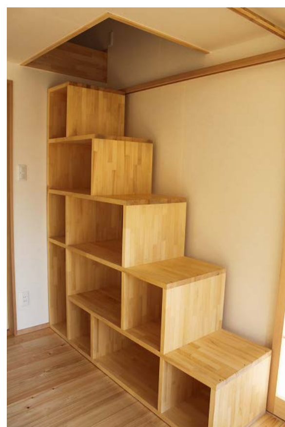
階段型家具イメージ