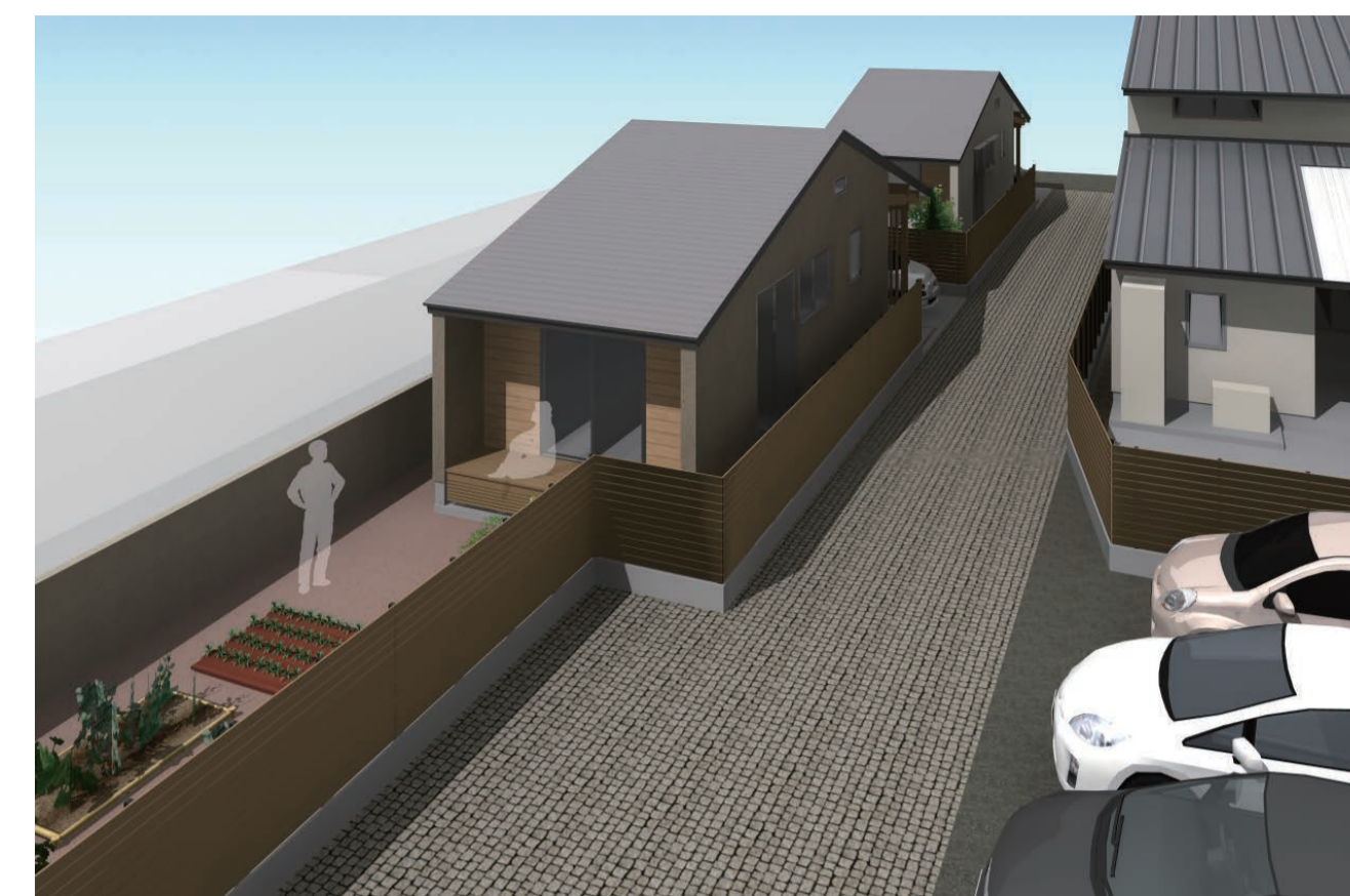
貸し駐車場廻りのイメージ