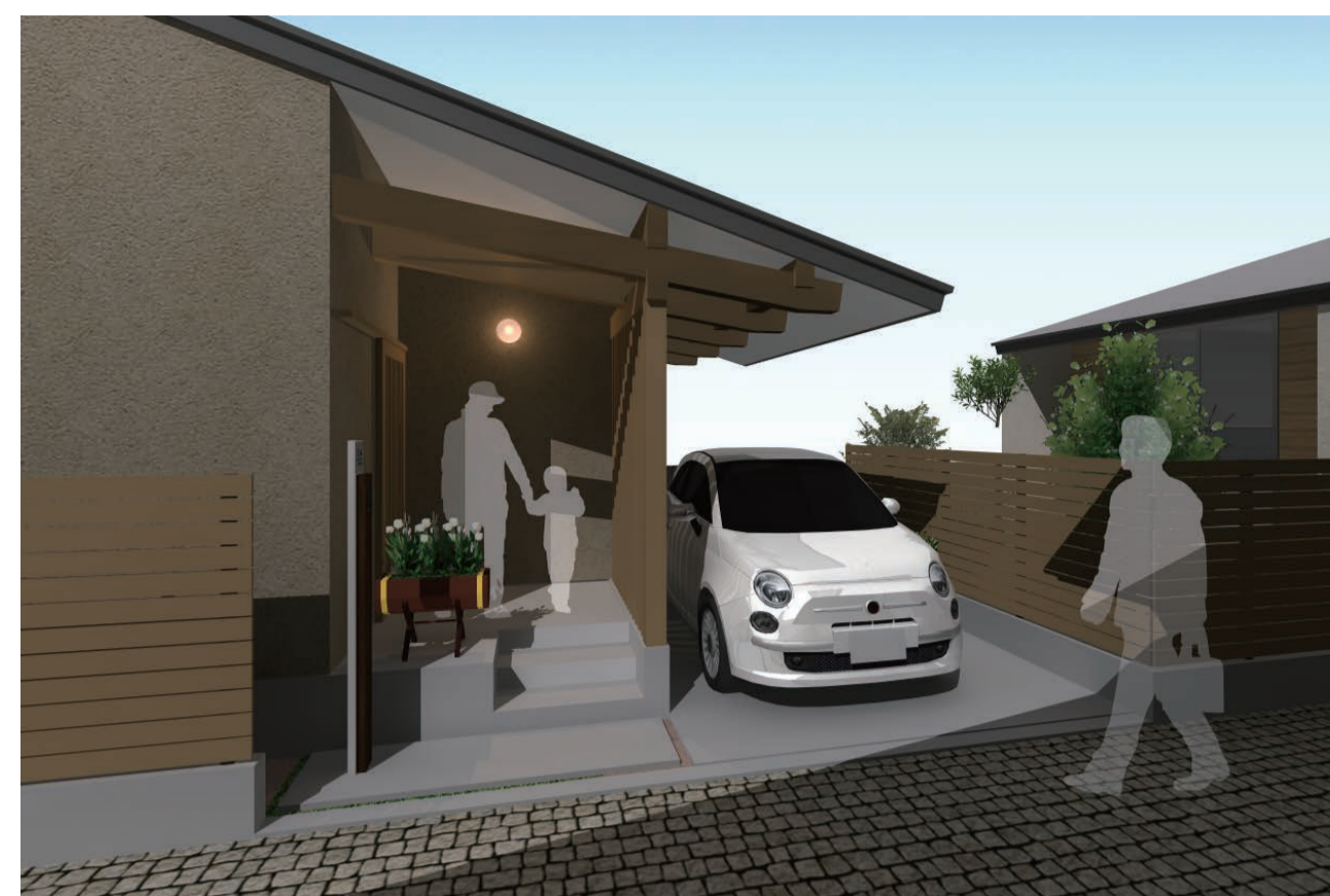
建物2-2ポーチ廻りイメージ