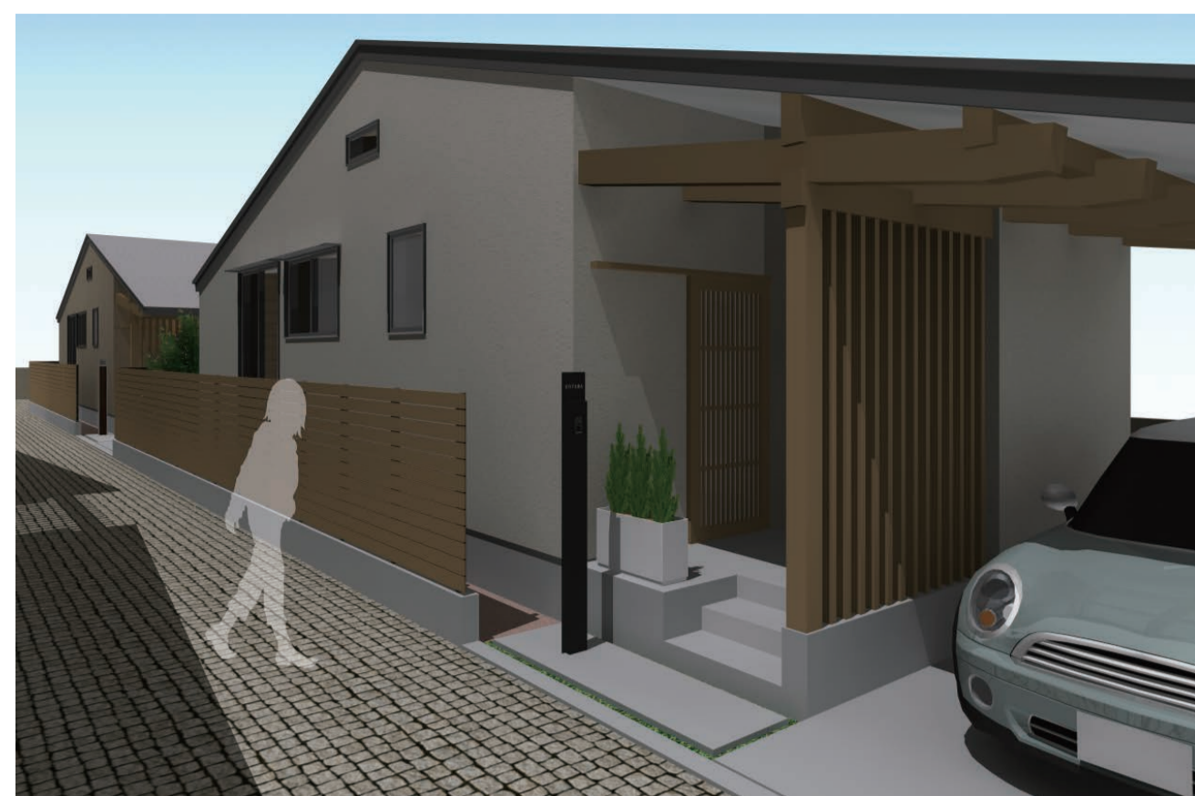
建物2-1ポーチ廻りイメージ